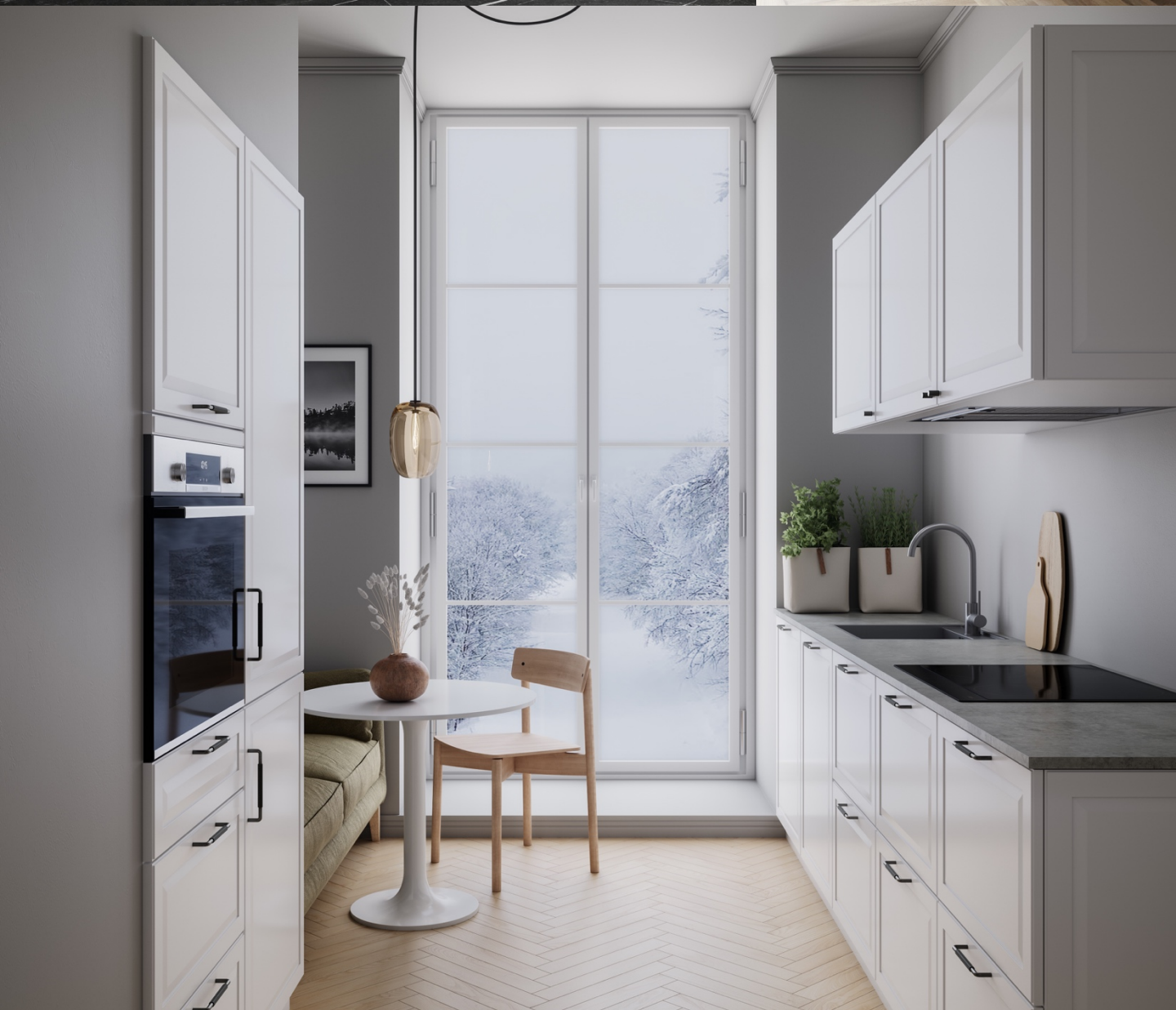
La cuisine Pavia dans sa version blanche