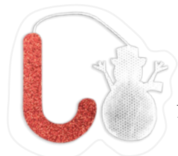
SACHETS BONHOMME DE NEIGE*