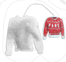
SACHETS PULL DE NOËL*