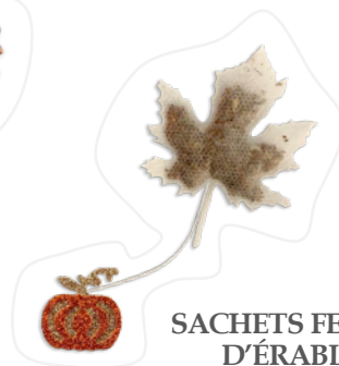
SACHETS FEUILLE D'ÉRABLE*