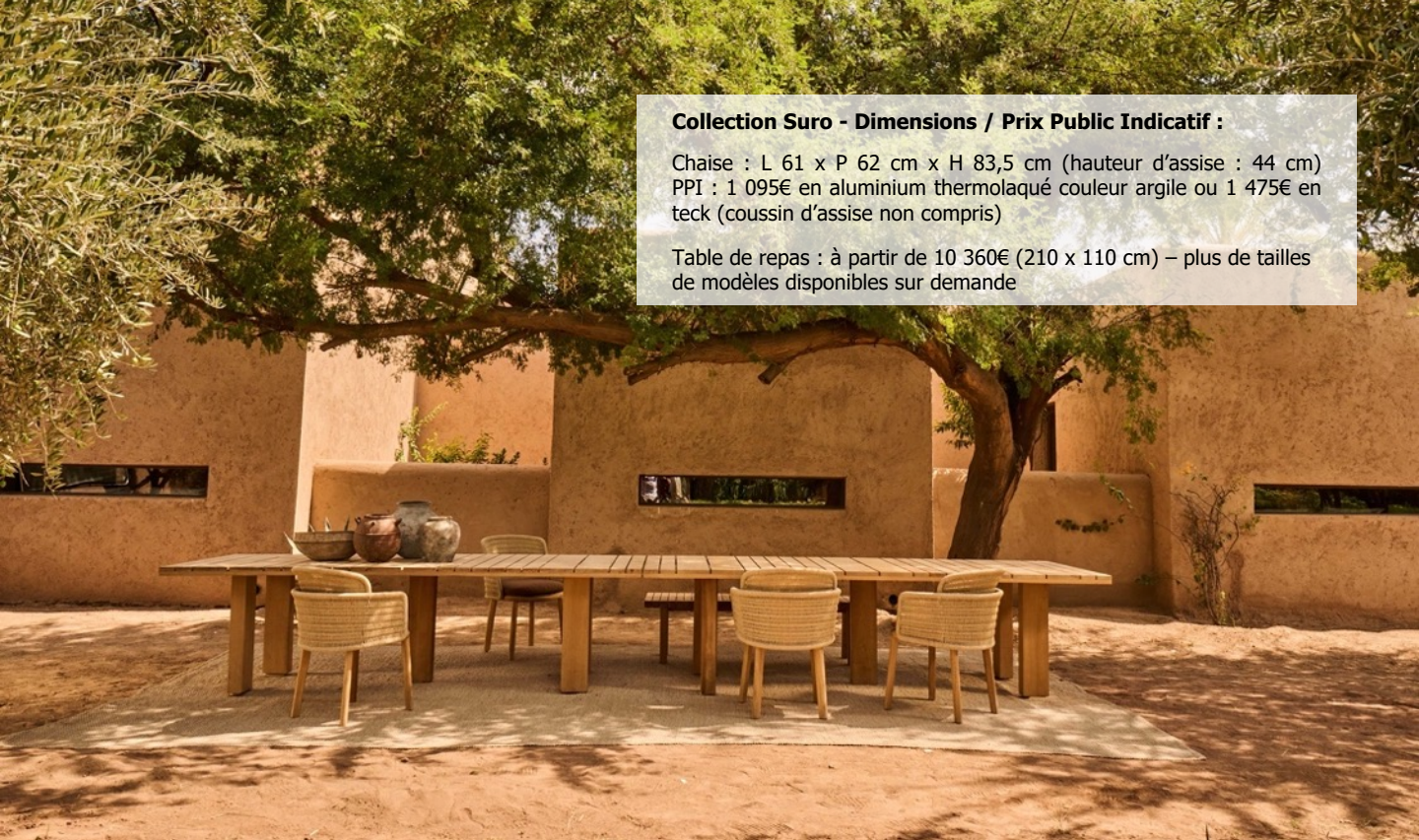
Table de repas : à partir de 10 360€ (210 x 110 cm) – plus de tailles de modèles disponibles sur demande

Chaise : L 61 x P 62 cm x H 83,5 cm (hauteur d'assise : 44 cm) PPI : 1 095€ en aluminium thermolaqué couleur argile ou 1 475€ en teck (coussin d'assise non compris)